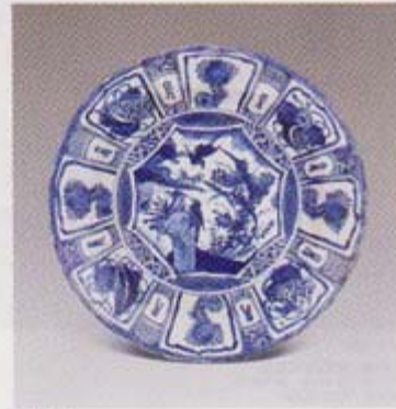
lot 1750 明万历 青花山水图 尺 寸 直径 36 cm 成交价 RMB 56,000