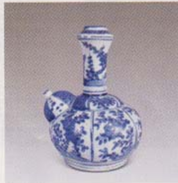
lot 1644 明万历 青花花卉图 尺 寸 高 22 cm 成交价 RMB 57,200