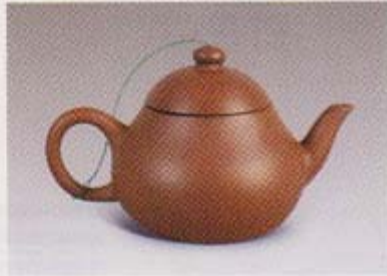
lot 1708 清中期 紫砂壶 尺 寸 高 16 cm 成交价 RMB 22,000