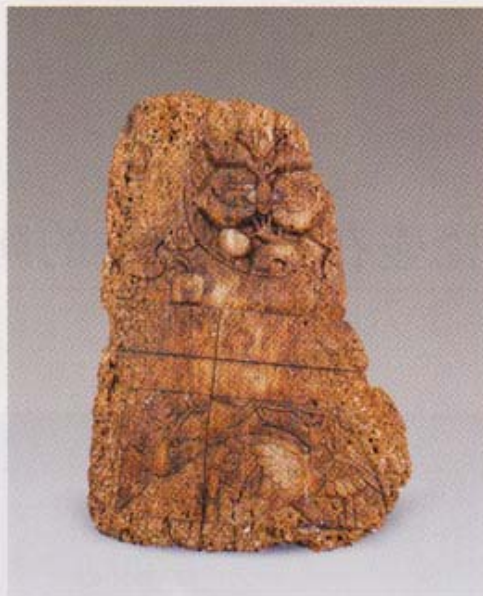
lot 1614 清 椰壳胎漆 尺寸: 高 48 cm 成交价: RMB 49,500

想起近年来中国艺术品拍卖的两个“传奇”：一是被美国贵族随便当了几十年台灯座的实四千万的雍正粉彩橄榄瓶，二是被荷兰贵族塞满了CD盘的卖两个亿的鬼谷下山大罐。在中国专业人士看来，他们是在暴殄天物啊，呵呵，不错，真正的贵族必须懂得暴殄天物——那两个物件虽然很值钱，但也不过是我们家传的两件可以用的瓷器，你们何必那么紧张