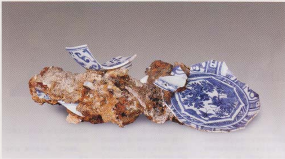
■ Lot 1812 四方盘 瓷片一拼 尺寸: 高41 cm 成交价: RMB 4,620

狂放的民间青花盘都竞争得相当激烈，参与者还有很多来自陶瓷收藏圈外。当然，这批器物的真实性是个强力的支持，但我更深切地感受到客人们并不像我们揣测的那么趣味狭隘，他们不仅喜欢瓷器的完美如初和抚之如凝脂美玉，也欣赏器物上的沧桑风雨，和逝去时光所烙下的蹉跎质感，并愿为之付出金钱。狭隘的是我们组织拍品的眼界和想象力。